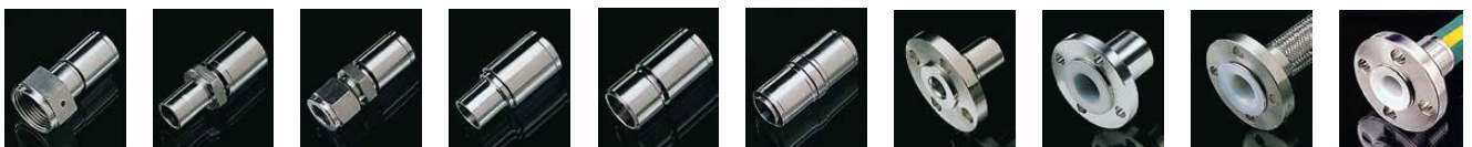
O-ring fêmea rotativa 'D' Adaptador de compressão Conector de compr. com porca Tubo soldado Cano soldado Emenda Flangeada Retentor de Flange 'P' Flangeada Retentor PFA Encap. Flangeada Flare Thru** Flangeada Flare Thru*