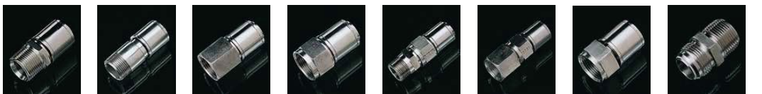
NPT Macho Hex NPT Macho NPT Fêmea JIC fêmea rotativa União NPT macho União NPT fêmea NPSH fêmea rotativa Adaptador JIC com PTFE