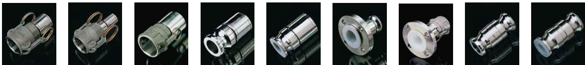
Cam Lock Fêmea 'D' Cam Lock Fêmea 'D' com redutor Cam Lock Fêmea 'D' PFA Encap. Cam Lock Macho 'E' Cam Lock Macho 'E' PFA Encap. Adaptador Flange Macho PFA Encap. Adaptador Flange Fêmea PFA Encap. Adaptador CAM Spool Adaptador Cam Spool PFA Encap.