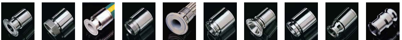
Tri-clamp Assento fêmea chanfrado Flare thru* Assento macho chanfrado Flare thru** I-Line Macho Step-up I-Line fêmea Mini Adaptador CAM X Macho